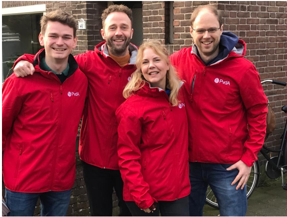
Heemstede 11 februari