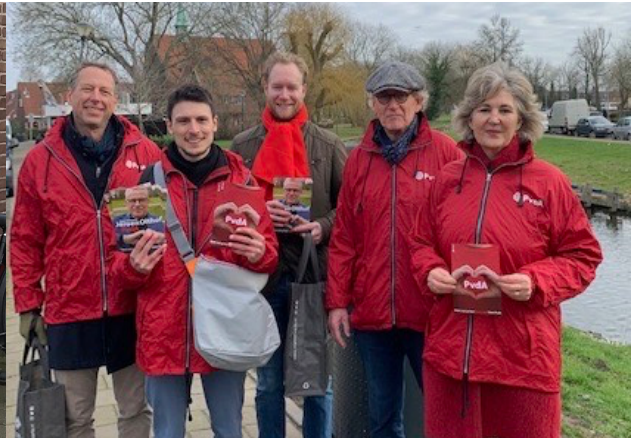
Haarlem (Amsterdamse Buurt) 11 februari