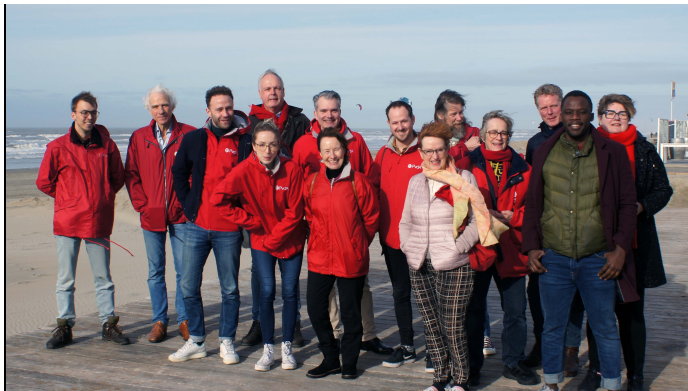
Rondje Zuid-Kennemerland met Waterschap kandidaten, 18 februari