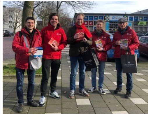
Haarlem (Parkwijk) 18 februari